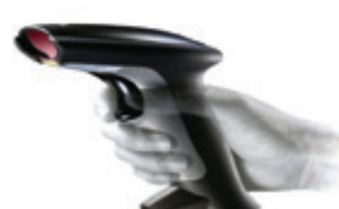
Lector de Bar Code para introducciones marcadas.